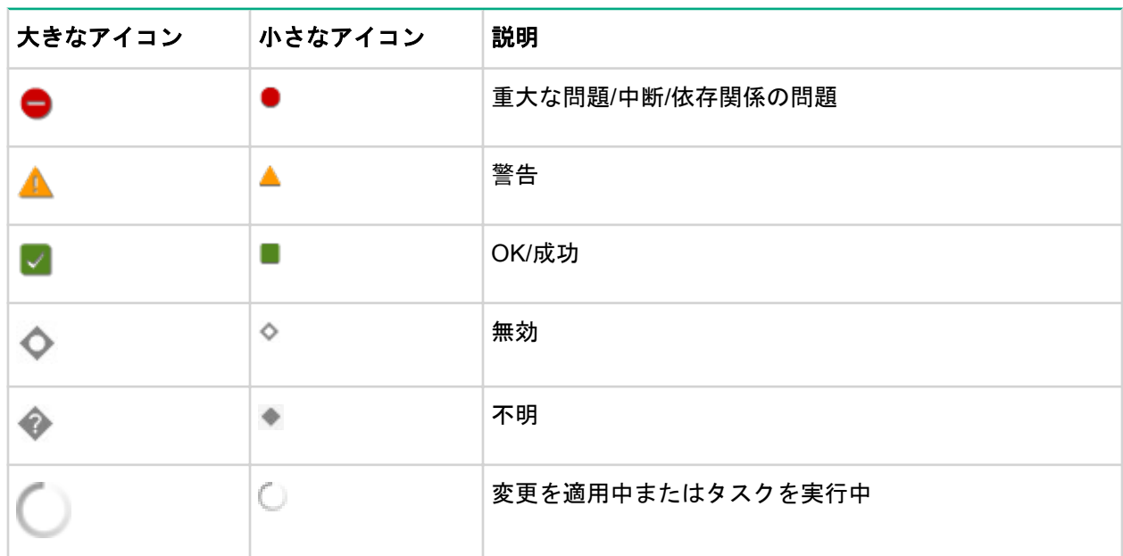
表 1: ステータスアイコン

SUM では、アイコンを使用してリソースとアラートのステータスを表したり、ディスプレイを制御したりします。